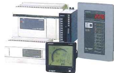
エネルギー・ユーティリティ監視機器 (H-NETシステム)