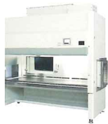
再生医療用キャビネット