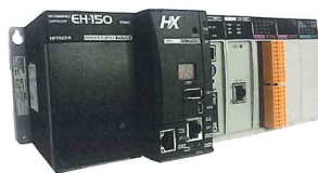
プログラマブルロジック コントローラ