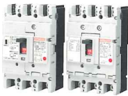
配線用遮断器・ 漏電遮断器