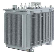
アモルファス変圧器