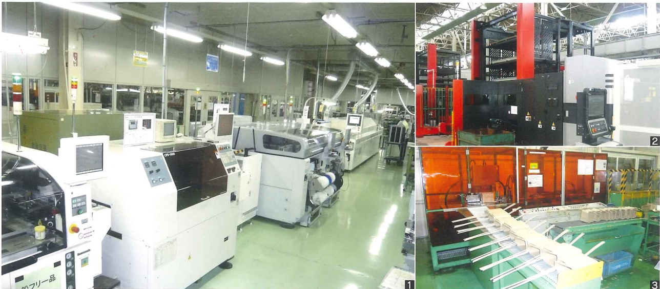
1鉛フリープリント基板組立ライン 2パンチ・レーザ複合加工ライン 3変圧器 平角線コイル成形ライン